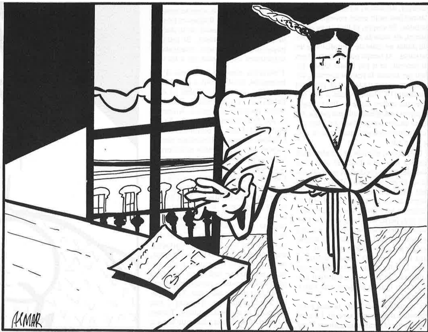
Hi havia, a l'embolic, el barnús i una carta,

de baixar i endur-te-la abans que no veiés l'estat caòtic del teu pis. Després, quan sigues al carrer amb ella, hi haurà més temps per a resoldre què fer i on anar. Per cert, i això és ben important, i, on la duràs a sopar? A veure..., si tu defenses que la intimitat comença per un acte de voluntat i, millor encara, si s'acorda a les expectatives de l'usuari, caldria esbrinar quines podien ser les seues intencions, i evidentment, també les teues. Estudies mentalment