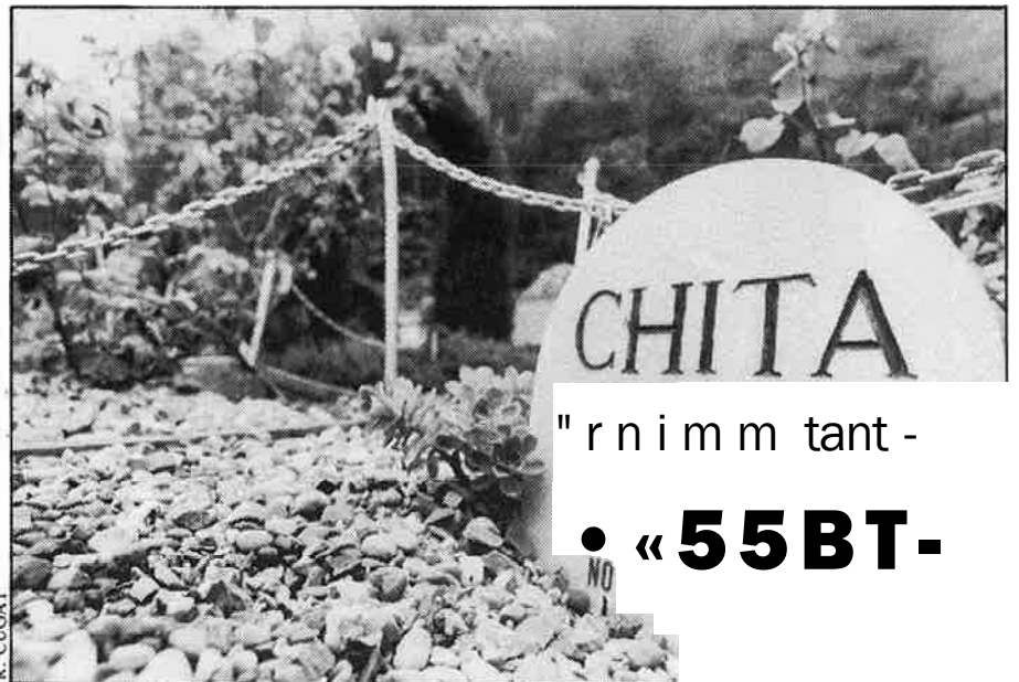
Els epitafis abasten des de la simple inscripció del nom del gos al poemari més extens.

«Una altra anècdota va ser la de l'home que va dur-nos el seu gos, que li havia salvat la vida. Va ser en un accident de cotxe, quan es va estibar