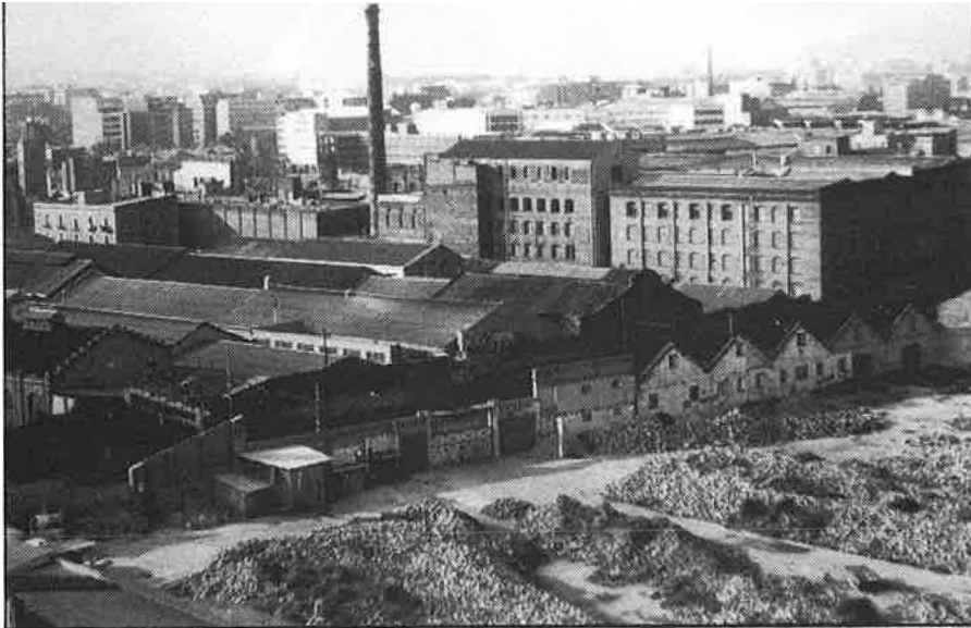
Terrenys del Poblenou destinats a la Vila Olímpica.

Respecte al tema de l'especulació, les opinions estan tripolaritzades. D'una banda, la Comissió Icària, integrada per veïns del Poblenou i representants sindicals dels treballadors d'algunes empreses afectades per les expropiacions, es mostra contrària a la ubicació de la Vila Olímpica i del Cinturó del Litoral. Creuen que l'especulació ja s'està donant dins el barri i per justificar-ho citen el cas de la fàbrica «La Paperera», que ara serà zona residencial, tot i que els veïns la demanaven com a zona verda.