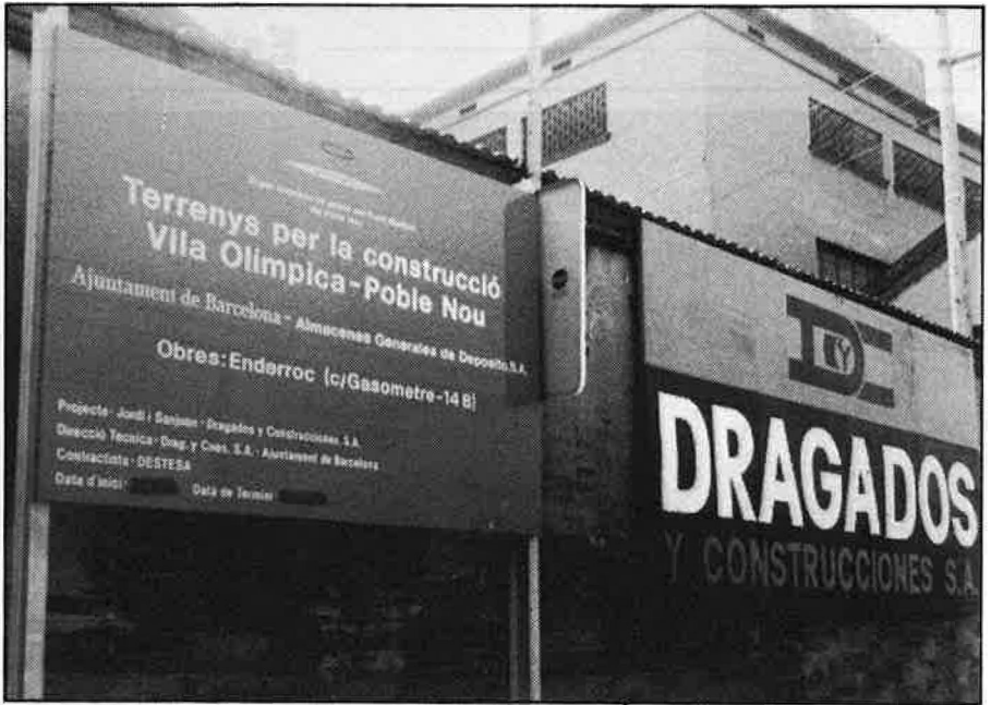
Motor Ibèrica i Dragados, dos empreses interessades en el projecte.

L'adjudicació del sòl a les immobiliàries que hauran de construir els habitatges és un altre punt que no està definit. Tot i que sembla que serà l'Ajuntament qui n'estipularà els criteris bàsics de construcció, el fet és que la iniciativa privada tindrà el control dels solars una vegada s'hagin adjudicat.