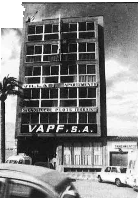
La seu central de VAPF, S.A.

Les necessitats de l'Ajuntament, el tema del ferri, el problema de l'aigua potable i del sanejament no són els proporcionals, per tant, a una població de quatre mil habitants, sinó a una població real que volta els trenta mil. A l'hora de les subvencions del Fons de Cooperació, Formentera no compta. I tota aquesta problemàtica es veu ara incrementada amb les notícies referents a la implantació d'un turisme que vindria a sumar-se al ja existent. Es a dir,