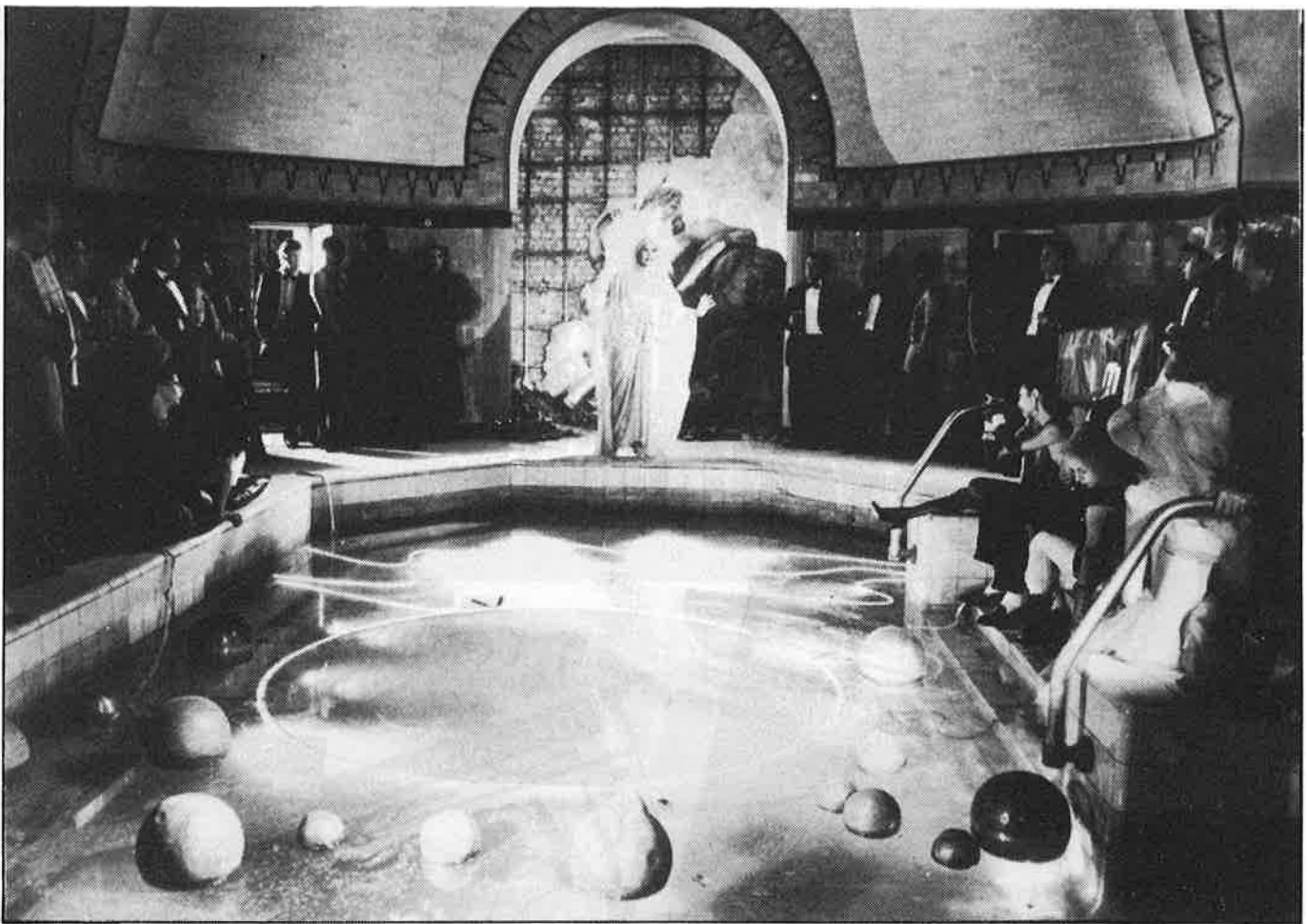
«Màscara» de Patrick Conrad.

plet i que allò que de més fresc i convincent tenia el film anterior s'ha marcit, potser per excés d'intel·lectualització.