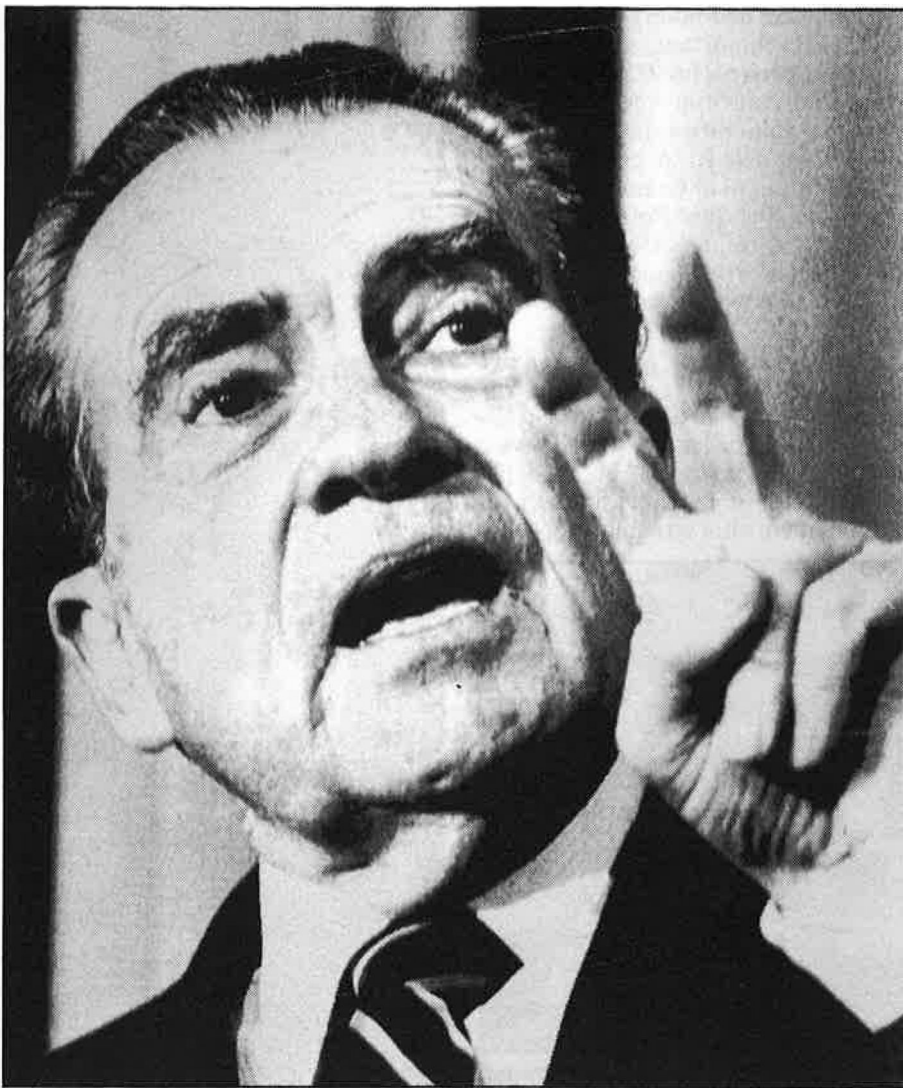
Richard Nixon, que algú bateja com «Tricky Picky», és a dir, Ricardet el trampós.

Però això és una altra història. O la mateixa.