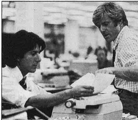
Hoffman i Redford interpretant Bernstein i Woodward.

Un any menys tenia Bernstein , un xicot de cabells llargs i aspecte de «progre» contracultural. S'havia fet en el Washington Star , on entrà a treballar als 16 anys. Des del 1966 formava part de la plantilla del Post . Deixeble de Tom Wolfe , va obtenir un dels seus primers premis el 1965, per contar les seues experiències durant la famosa apagada de llum de Nova York. Publicà treballs sobre els barris, les drogues, l'actuació de la policia o els fiscals, la violència i el roc. La resta dels companys de la redacció van poder palesar la mútua antipatia que se sentien ambdós periodistes. Això no obstant, el cap de la secció local del diari els posà a treballar junts i en poc temps formaren un equip bastant compenetrat, un tàndem que rebé el nom de «Woodstein».