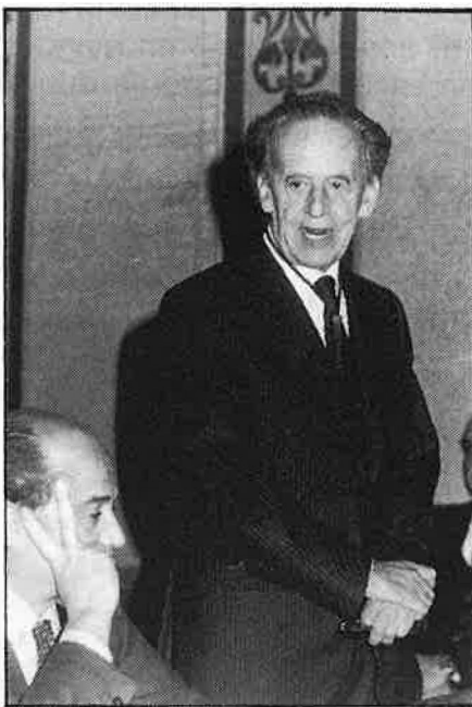
Antonio Hernández Gil, president del Consell General del Poder Judicial.

La disjuntiva entre el jutge natural i els tribunals estatals és el que frena ara la reforma de la llei antiterrorista, reforma que unes hores abans de l'atemptat de l'Hipercor de Barcelona era considerada «imminent» pels ministres Barrionuevo i Ledesma. El president Felipe González haurà de decidir personalment després de l'estiu. Els indicis en aquests moments són que es decantarà a favor de donar competències als tribunals bascs en aquesta matèria, però potser no totes. Per exemple, els judicis es podrien fer al País Basc i, les diligències, les duria l'Audiència Nacional o viceversa. •