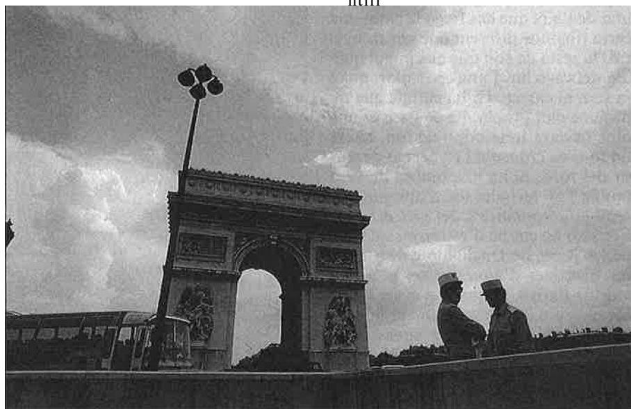
La place de l'Étoile, amb l'Arc de Triomf.

sol d'una freda resplendor blanquinosa i on el blau esdevé pàl·lid, nacrat, llunyà, quasi irreal. Però el més bonic són les nuvolades: immensos castells de núvols blancs o blavosos, o rosats a l'hora de la posta. Un vertader espectacle.