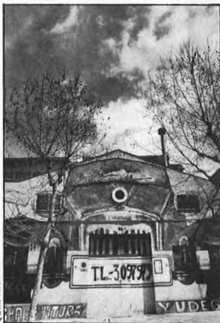
Restes d'un paisatge industrial que ara desapareix.

Amb la desindustrialització, les empreses han anat tancant o traslladant-se. La guerra primer; la crisi industrial, l'obsolescència de la maquinària i altres factors després, a poc a poc han anat transformant el vell reducte del