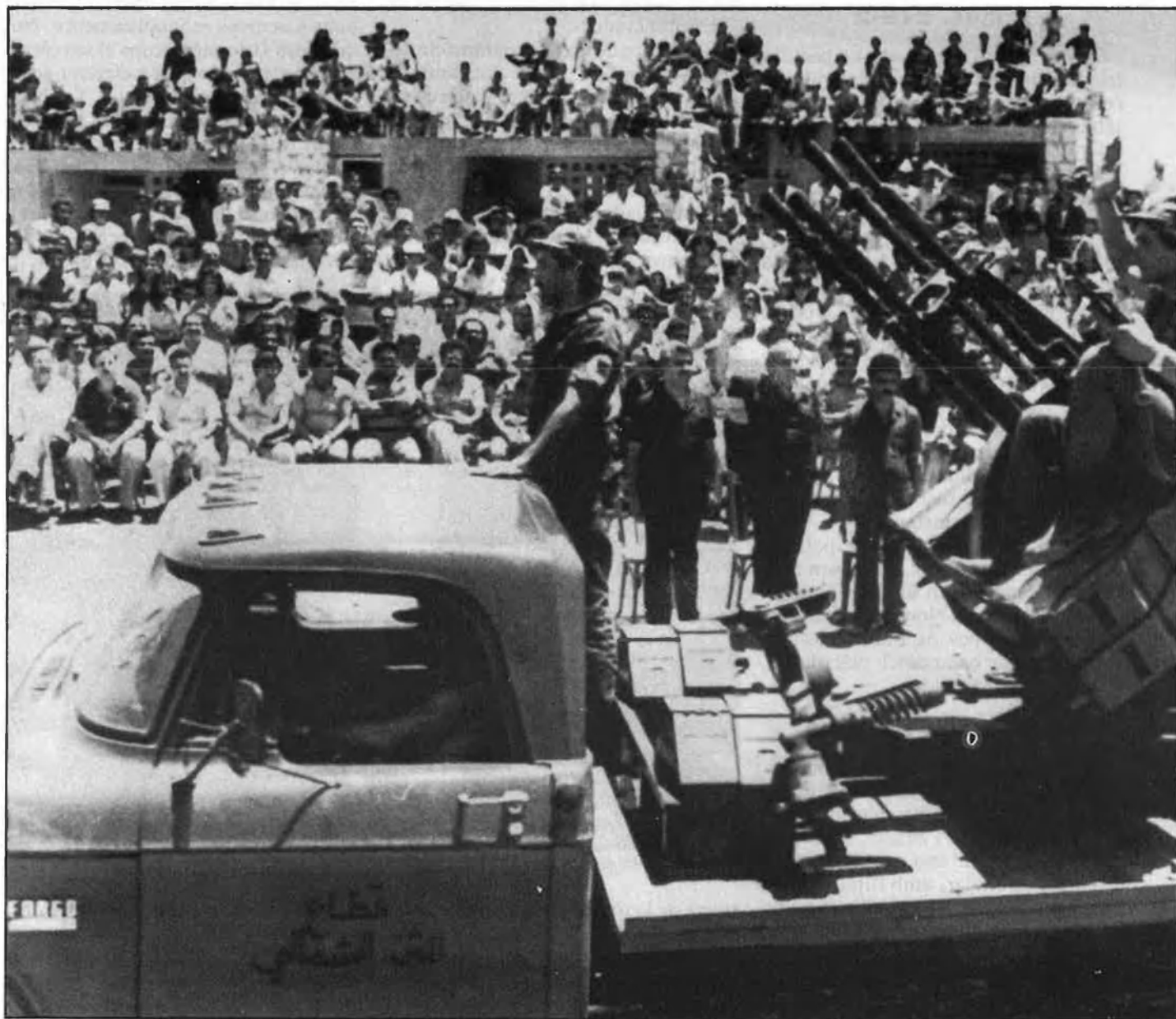
UNA COMPLEXITAT ENCESA I IRREVERSIBLE