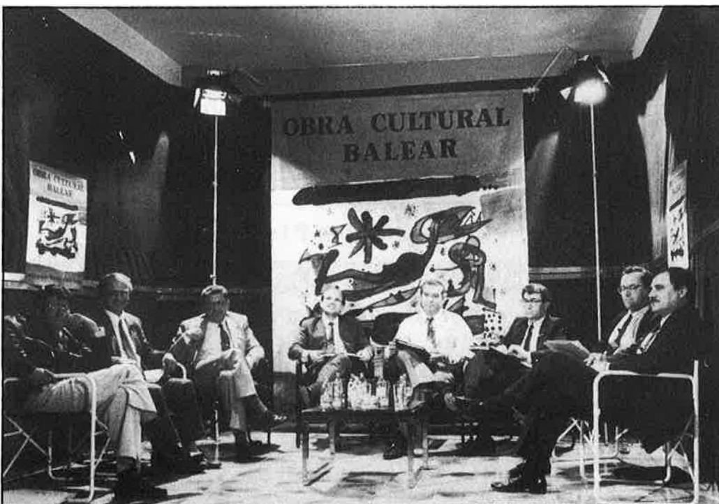
Debat de Voltor: els candidats a les autonòmiques.

Ara bé, si el pas d'unir els tres centres televisius amb una mateixa llengua és avui una decisió que RTVE no posarà en marxa, sí que