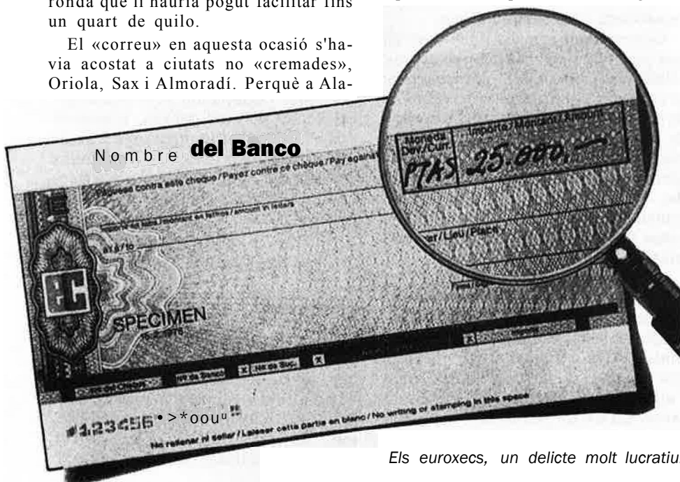
Els euroxecs, un delictes molt lucratiu.

Els quinze detinguts, de distintes nacionalitats, eren tots correus o canvis-tes d'aquests xecs furtats a Europa i són senzillament una prova —una més— que, com afirmava no fa gaire el governador civil, Virginio Fuentes, «Alacant encapçala el rànking de la delinqüència internacional». Aquesta declaració, que fou pronunciada durant la presa de possessió del nou comissari provincial de policia, el cartagener