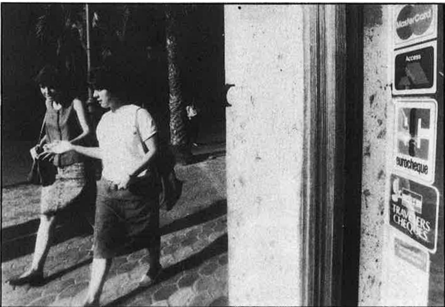
El límit màxim de 25.000 pessetes protegeix els bancs d'unes estafes més fortes.

Tot i que les mesures de control esdevenen cada vegada més rigoroses i les comprovacions, són més insistents, el cert és que per més recomanacions que facen els bancs, l'estafa dista molt de fer-se impossible. I segons aquest tècnic, la intuïció, la mundologia i la psicologia aplicada no són un mal ajut per al caixer que ha de detectar l'engany. «A vegades és l'observació el que et fa pensar que alguna cosa no funciona. Això és el que ens passà amb una argentina. S'excedia en familiaritat, parlava massa, era extraordinàriament amable, molt més del normal, i es feia massa la simpàtica. De sobte, vam notar que el seu passaport contenia una entrada molt estranya, des de Portugal. Ella també s'adonà que passava alguna cosa. Aleshores va dir: 'Tomé de seguida, vaig un moment a la perruqueria...' i ja no l'hem vista mai més».