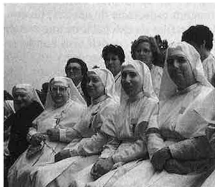
La fotografia en grup és el record obligat de Lourdes.

tots els anys, centenars d'invàlids, retardats mentals, desnonats per la medicina oficial i casos irreversibles mamprenen el camí per trobar-se al mateix lloc on, un 11 de febrer, la història del catolicisme diu que Bernardette va veure la Verge. Es calcula que al llarg dels 43 pelegrinatges realitzats fins ara han estat més de 40.000 els valencians transportats, 10.000 d'ells ma-