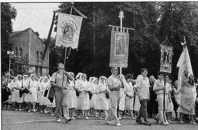
Processons multitudinàries de malalts, infermeres i préberes.

tanta gent. Són moltes les coses que ja no agraden: la televisió, el terrorisme, la drogaaddicció, etc. Quan tot això es perd, cal recuperar l'essència de les coses. D'altra banda, han aparegut noves religions, vidents, aparicions, Bernardettes. Tot això són símptomes que la gent busca alguna cosa, i a Lourdes la troba».