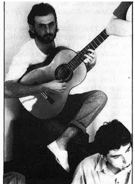
Cànem: el Mediterrani com a àmbit sonor.