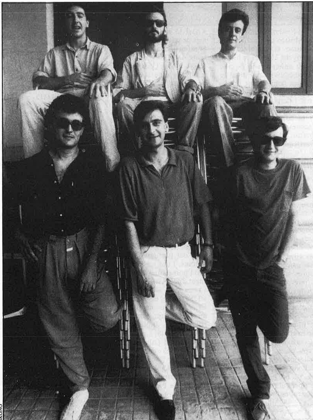
«El problema sempre ha estat el mateix: la precarietat de mitjans i, a més, un públic reduït».

— Vicent. Sembla que sí. El terme ja s'ha consagrat ací i fora i hi ha una música que funciona. Nosaltres anem en aquest carro.