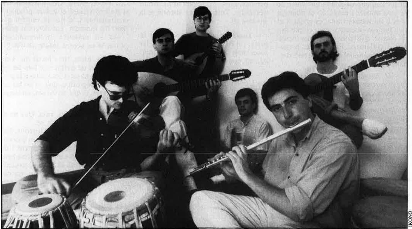
«Una casa de gravacions és com una casa de dones: entres i toques el que pots».