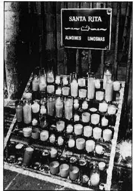
Les collectes, els donatius, i en general, les aportacions dels fidels són l'ingrés més important.

els fidels aporten el seu donatiu—, i les Publicacions —Full Dominical, llibres, revistes, multicòpia, etc.