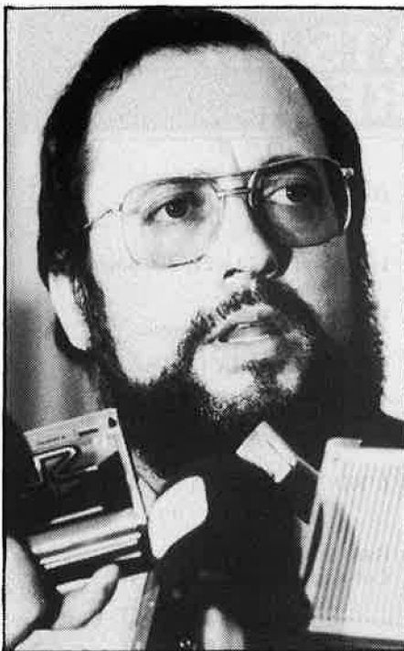
Gerardo Fernández Albor i José Luis Barreiro.

abandonaments que havien començat una setmana abans en Alianza Popular. Però Gerardo Fernández Albor , ja és víctima de les pròpies contradiccions i de la falta d'un projecte polític per a la comunitat autònoma.