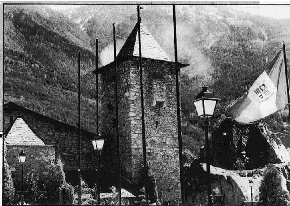
Aspecte del pati de la Casa de la Vall, seu del Consell General.

Un total de set parròquies o circumscipcions formen el Principat d'Andorra. Cadascuna elegeix el Comú —consistori— i els dos cònsols —alcaldes—. El comú està format per deu regidors i tenen el poder administratiu de cada circumscipcio. Igualment, el sistema electoral és el majoritari a dues voltes, sempre que es faci necessari, si el candidat no ha obtingut majoria absoluta. •