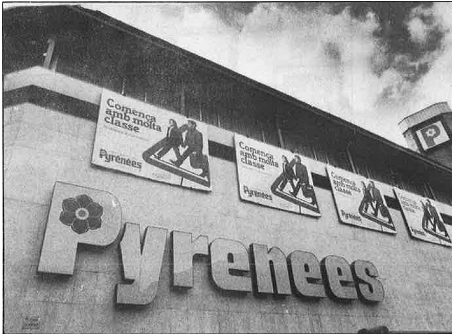
Els andorrans consideren «bo» l'actual equilibri.