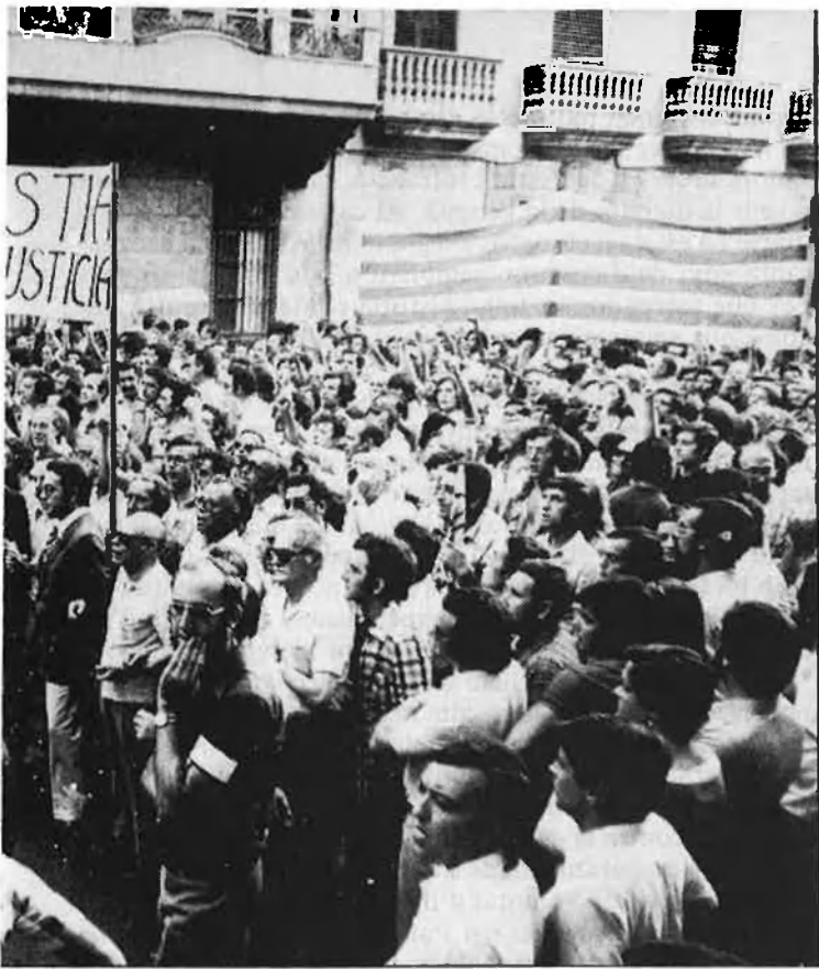
Manifestació a València, al juny del 76.

ticpar, ha estat tractada pels poders públics com a extraterritorial i contemplada com una perillosa intromissió la difusió entre els valencians.