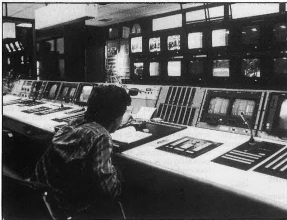
La regla d'Orwell es fa real, sobretot, als mitjans de comunicació.

Acabem d'anomenar «minoritàries» aquestes llengües. Ho són, és clar, però l'Estat espanyol ha tractat i tracta, en la constitució i els estatuts, de fer-les més «minoritàries» del que són en realitat. El català, per exemple, ha quedat formalment limitat a Catalunya. L'Estatut del País Valencià parla només de valencià, sense la menor referència al català, del qual sembla amputat. També per aquest costat es fa evident la voluntat del legislador de dividir i limitar el català. Això, ni és democràtic —és una raó d'estat— ni