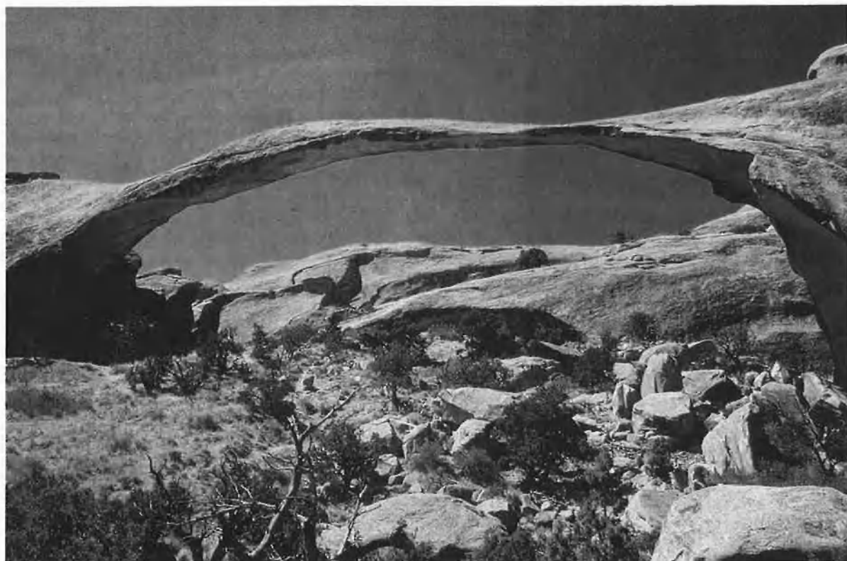
A l'esquerra, el parc Yellowstone i les Badlands. Dalt, Grand Canyon i, baix, una formació de roques en forma d'arc al parc Bryce.