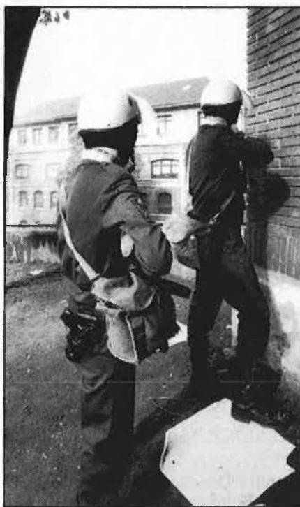
Policia nacional, responsable en darrer terme de la seguretat.

Les accions terroristes hagudes a Tarragona i a Barcelona han suposat, d'altra banda, un fort increment de la