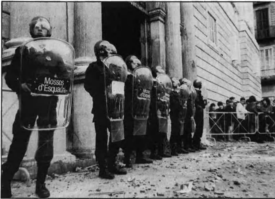
Mossos d'esquadra, cada vegada més auxiliars.

mossos d'esquadra. Segons Jaume Bosch , subdirector general de Coordinació de Polícies Locals, la policia local hauria de ser una policia bàsica, això és, assumir les competències de seguretat i ordre públic. Les polícies locals són les més acostades als ciutadans, però, per ara, tenen una funció secundària, limitada a vigilar l'aplicació de les ordenances municipals i a donar suport a la policia de l'estat en els casos urbans, o a la guàrdia civil, en el món rural.