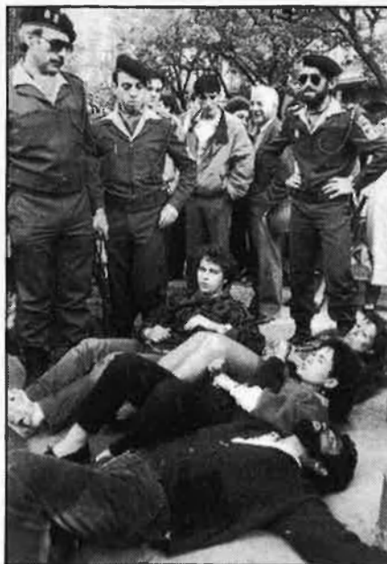
L'autèntica policia del país.