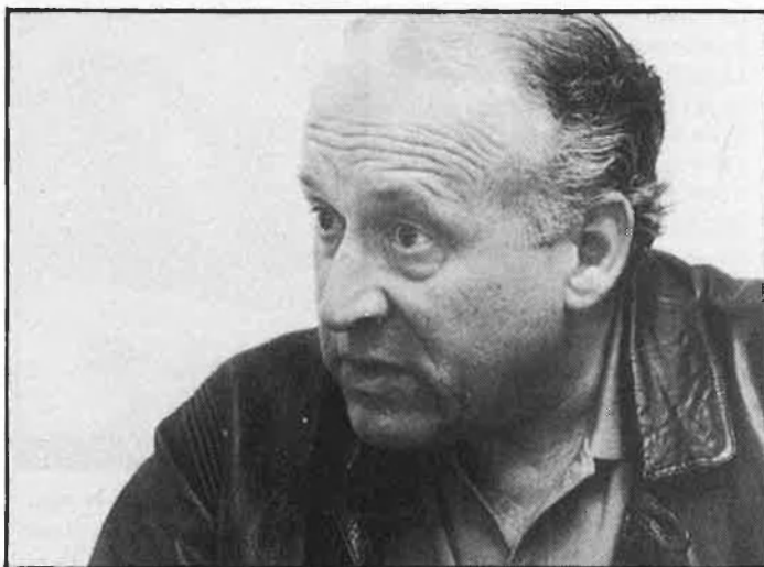
«Al desembre renovarem tota l'estructura del PNB».

Pel que fa a les eleccions a Juntes Forals —a diputacions, per dir-ho des d'aquí d'una manera més entenedora—, que a Euskadi es voten de manera independent als ajuntaments, el PNB passa de controlar Àlaba, Biscaia i Guipúscoa a mantenir tan sols la presidència de Biscaia. La Diputació alabesa passarà a mans del PSOE —mit-