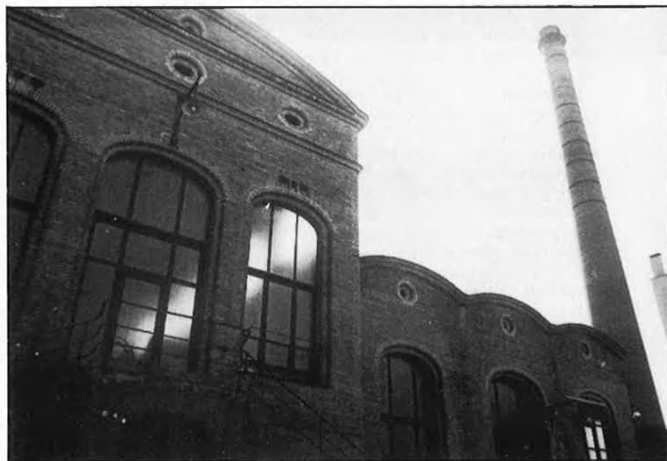
Les antigues fàbriques s'ofereixen com un potencial excel·lent amb la reutilització per a nous usos.