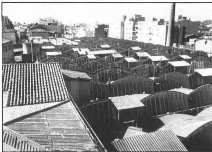
El museu de la Ciència i de la Tècnica, a Terrassa.

«De totes maneres —continua—, la gent les respecta cada dia més, potser