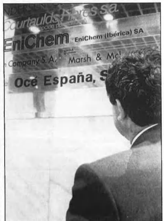
Algunes de les empreses que patrocinen l'encontre.