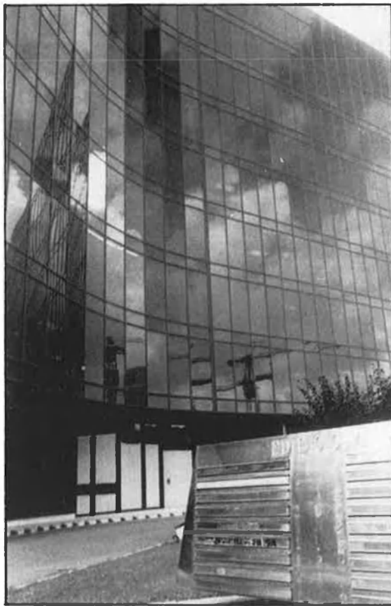
Enichem Ibérica, filial de l'ENI italià.

La «Nova Política de Desenvolupament» que proposa l'Aspen Institute passa, com deixa ben clar el manifest, pel coneixement i l'intercanvi continuat d'impressions entre inversors privats, governs i organitzacions internacionals dels països implicats. I aquest és, potser, el més important dels objectius de la Tercera Conferència, que comença, la setmana vinent, a Barcelona. Polítics, alts executius i representants d'organitzacions internacionals podran trobar-se, xerrar i establir contactes durant i al marge de les sessions de tre-