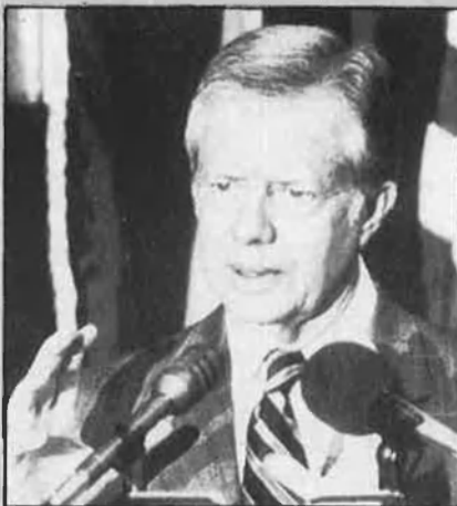
Melina Mercuri, Enrique Barón i Jimmy Carter.

nitzar la vida i mantenir-la humana». Sembla ben improcedent, però, tractar de buscar-hi relacions amb associacions de tipus pseudo-sectes: els executius nord-americans no van amb tants romanços. I la cosa és més prosaica. Segons la història oficial, l'Aspen Institute sorgí l'any 1950 arran de la celebració amb què a Aspen (Colorado)