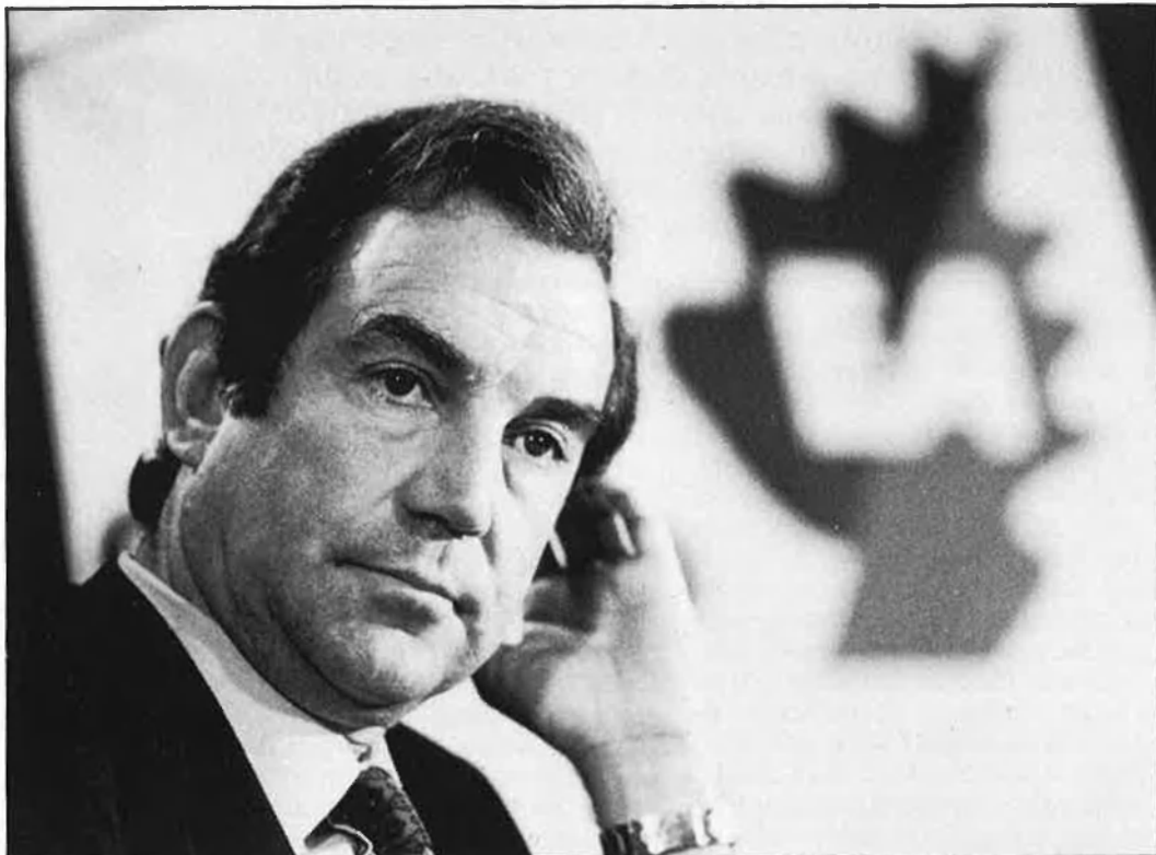
«El que hi ha hagut, sobretot, és un creixement del nacionalisme».

—A Navarra hi ha hagut un important avanç del nacionalisme, molt fort, i un retrocés considerable del PSOE. És molt important, doncs, el resultat