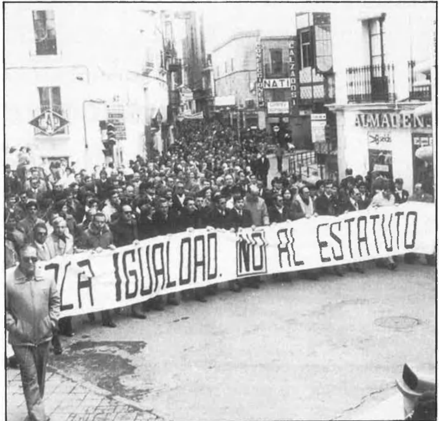
Manifestació a Càceres contra el text estatutari, on inicialment Badajoz tenia cinc representants més al Parlament.

Aquesta difícilíssima situació ha motivat que a Navarra es parla ja d'un possible acord sobre temes puntuals entre el PSOE i UPN, que permetria els socialistes continuar governant i que donaria als unionistes la presidència del Parlament i l'alcaldia de Pamplona.