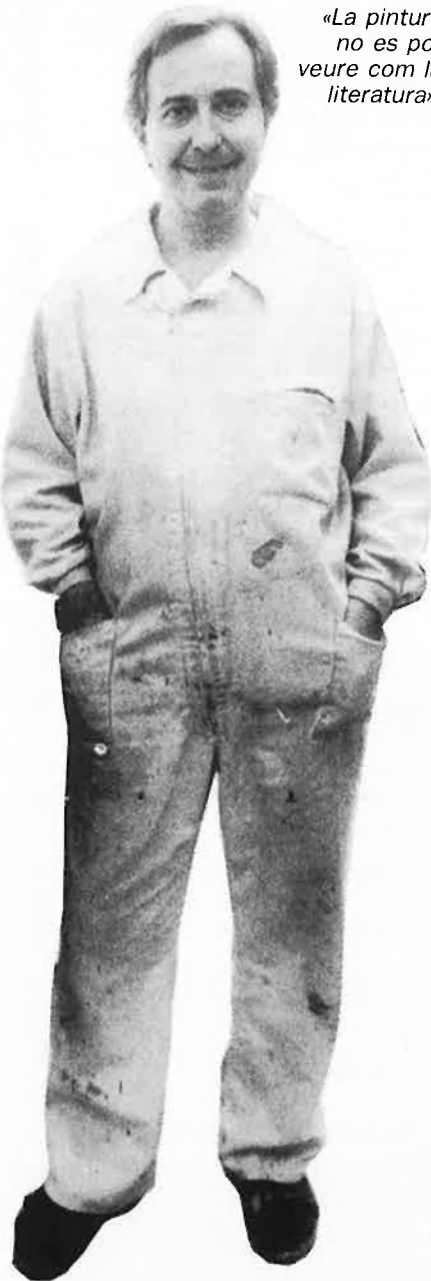
«La pintura no es pot veure com la literatura».

—Nosaltres sempre ho havíem valorat. És bastant evident. Però de vegades s'ha dit que treballàvem aquests temes amb molt de distanciament, sense estima, i no és cert. Treballàvem sobre uns quadres perquè eren les obres que estimàvem. Precisament, a la darrera exposició meua, a París, el tema era el Museu del Prado, tot fent-ne una lectura polèmica. Perquè en aquests mo-