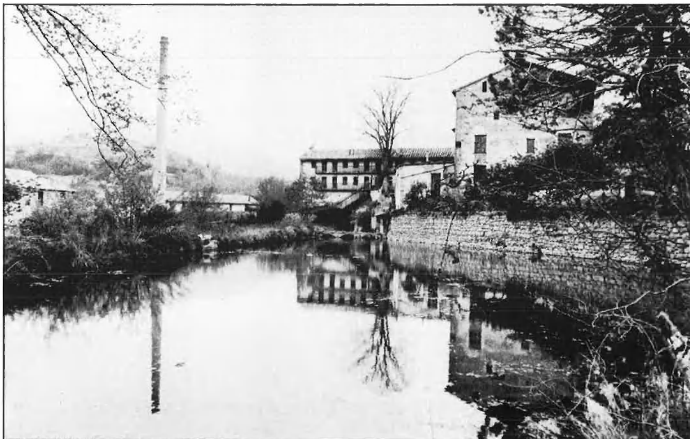
Fàbrica de Giner, grup de Morella, únic vestigi de la revolució industrial als Ports.