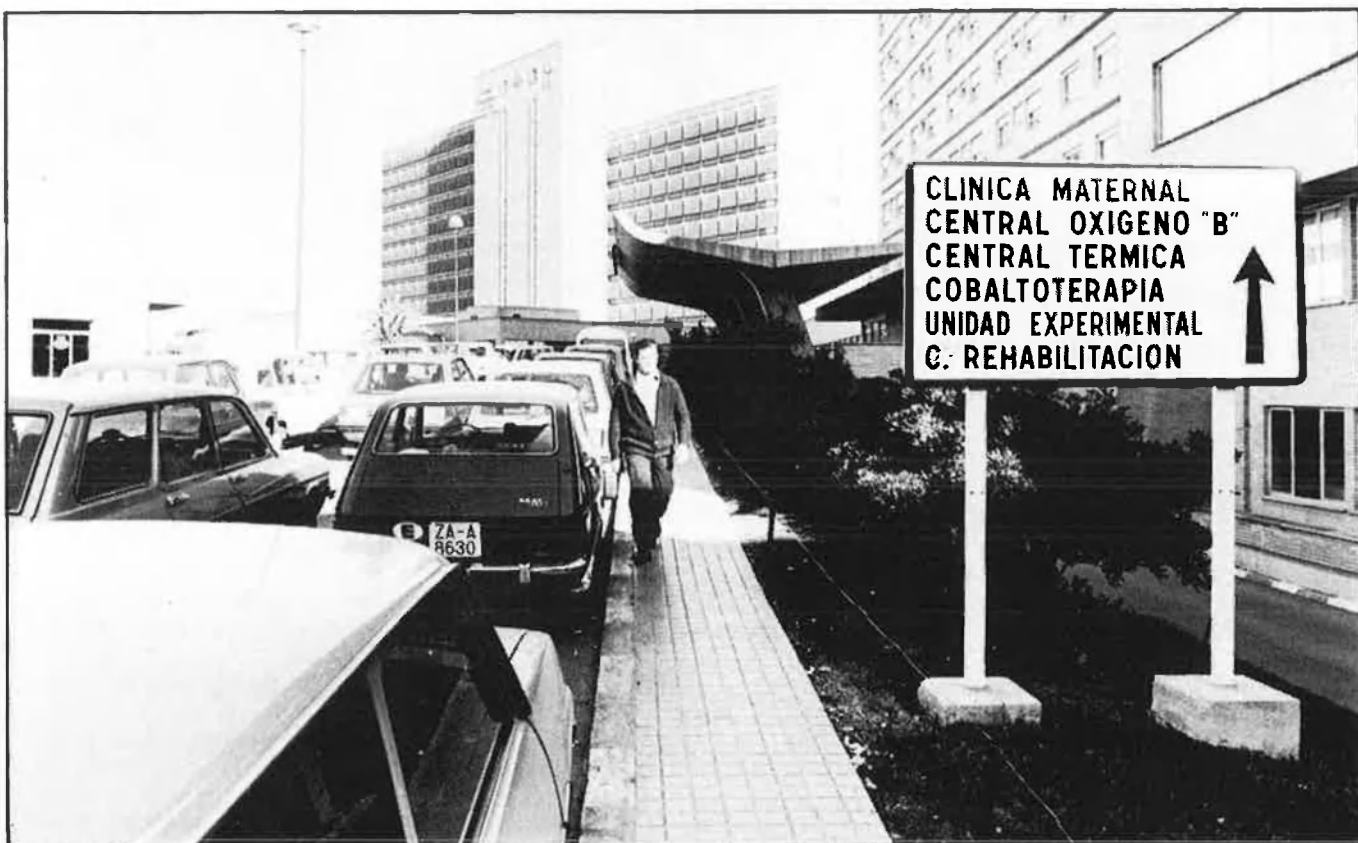
23.000 NOUS FUNCIONARIS VALENCIANS