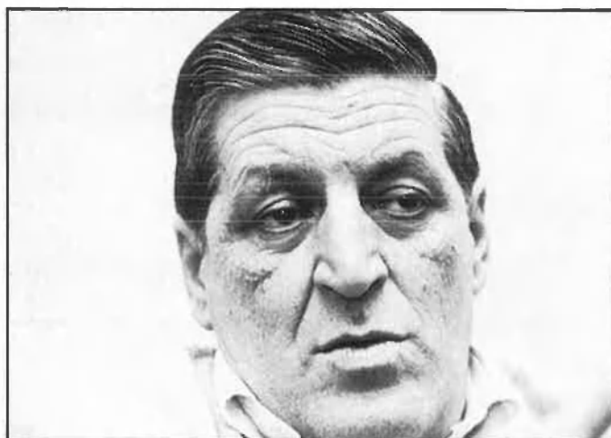
Segons les primeres converses, l'alcaldia serà per al més votat... o per a un àrbitre.

Arjona, per la coalició IU-UPV. En el transcurs de l'acte, on, com ja és habitual en debats anteriors, els partits de la dreta, més que defensar els seus programes respectius, aprofiten per atacar la gestió del PSOE, es va deixar entreveure, a més, la possibilitat d'arribar a un pacte postelectoral entre AP, UV i CDS de cara a destronar el PSOE de l'alcaldia de la ciutat.