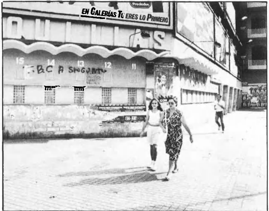
Només una política de planter, de «club modest», pot afermar l'ascens.

A pesar que s'han comès errors, l'equip Tuzón ha gaudit de la virtut de saber dissimular i tapar qualsevol esvarada. Actitud que contrasta amb èpoques recents en què les divisions internes propiciaven punyalades entre les distintes bandes constituïdes. Així no