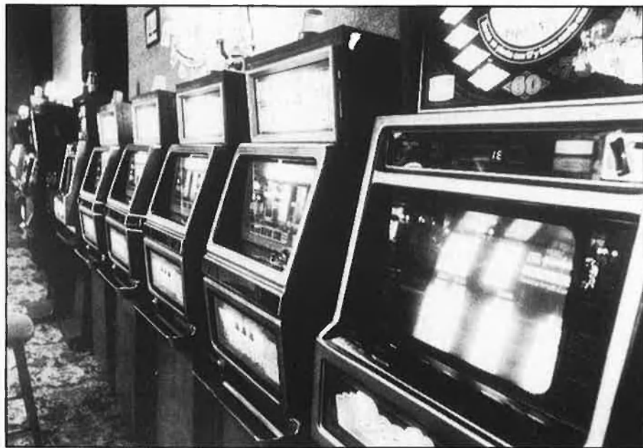
Un imperi econòmic personal bastit sobre els beneficis de les màquines escurabutxaques.