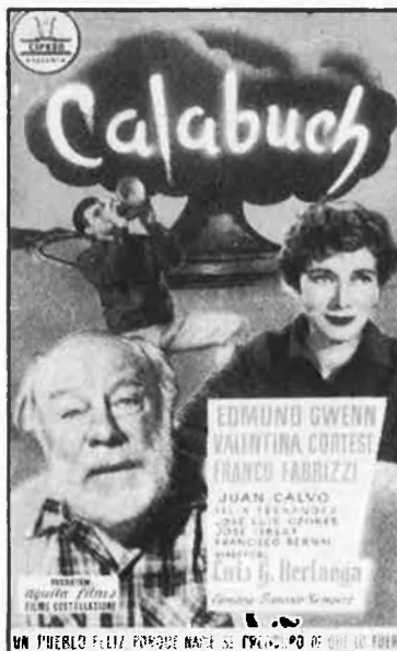
Pel·lícules distribuïdes per Cifesa, una forma encoberta de producció.

casa el 1944, de lector de guions —els seus antics poemes en català potser hi ajudaren—. Després n'escrigué alguns. I arribà a director anys a venir.