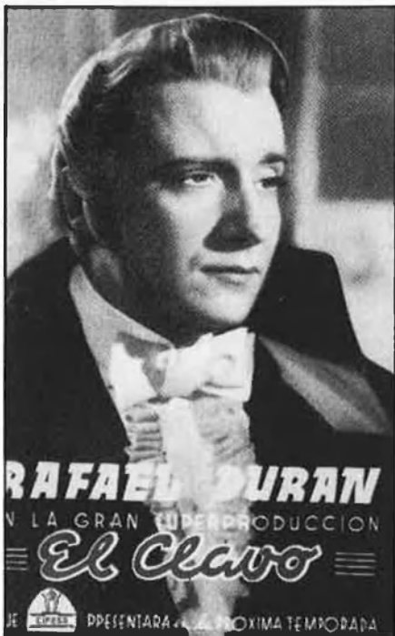
Tres èxits de Cifesa: la versió local del gènere EUA.

Quant als directors, tres mereixen el record. Juan de Orduña s'encarregà de melodrames i cintes fastuoses. Si mai no dominà la cal·ligrafia de l'ofici, hi posà un nervi i un arborament que llavors agradava. Rafael Gil , el millor, coneixia més recursos. Huella de luz , per exemple, és una comèdia amable i una mica patètica. Gil també intentà d'imitar el Hitchcock de Rebeca amb un material tan poc al cas com Jardiel Ponce ( Eloísa está debajo de un al-