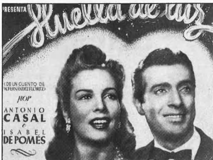
La producció de Cifesa, de la comèdia lleugera a l'epopeia imperial.