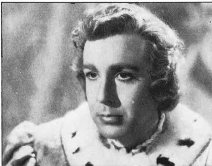
Amparito Rivelles i Fernando Rey. Dalt, Imperio Argentina.

ma espanyol. Duia per títol Compañía Industrial del Film Espanol, S.A. És a dir, Cifesa».