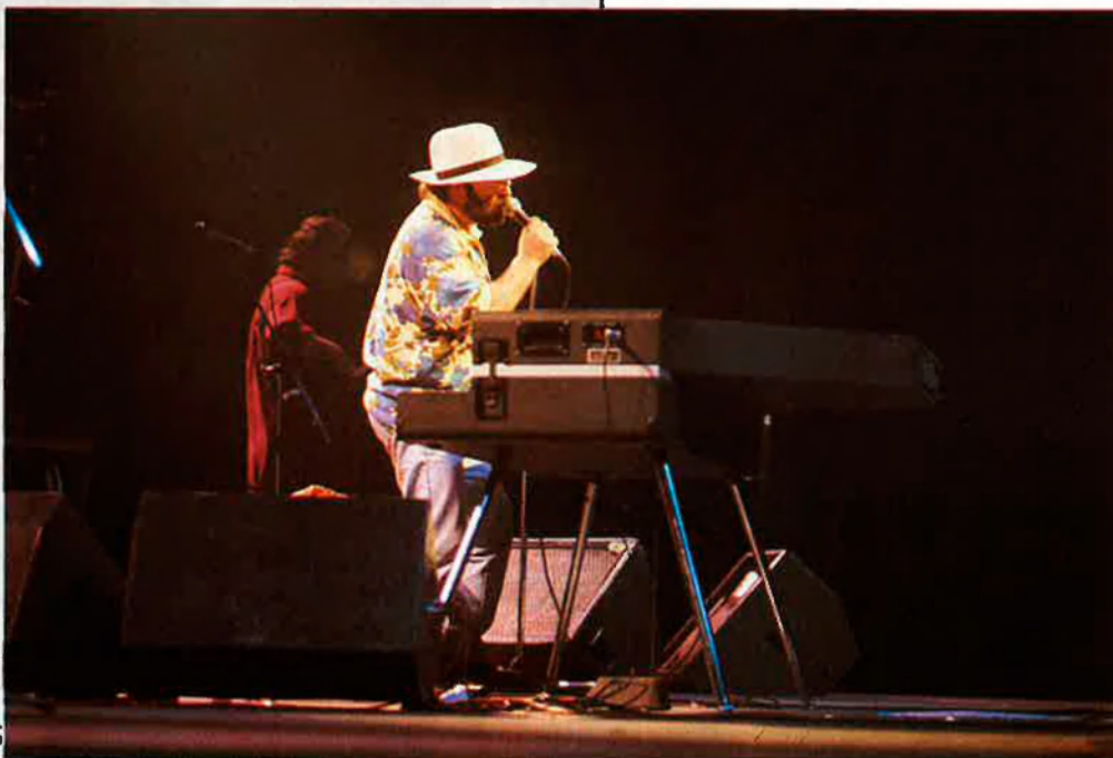
«Encara no he comprès Itàlia».

Esperem que la pròxima volta no caldrà esperar tant de temps per a escoltar-lo. Ni anar tan lluny. □