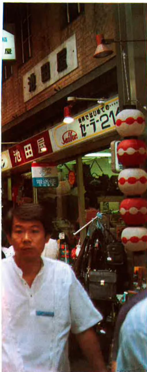
Els japonesos consumeixen ja com els occidentals.

L'espectacular i continuat èxit d'aquesta economia d'exportació (que, de controlar el mercat de transistors, ha passat per les càmeres fotogràfiques, els automòbils i ara els microordinadors), acompanyat del descens del preu del petroli (que el país ha d'importar totalment) i de la inseguretats internacional davant el dèficit pressupostari o les febleses de l'economia nord-americana, ha portat a una pujada mantinguda del ien japonès, que no se sap on s'aturarà: el juliol de 1985, un dòlar equivalia a 239 iens; el gener del 1986 estava a l'entorn dels 200 iens. Ara està en 142 yens, i el dòlar continua baixant.