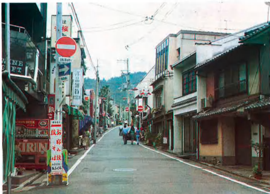
Fer front a l'occidentalització conservant les tradicions.

gegant amb peus de fang. Té por que la seua economia basada en l'exportació no pugui prosperar indefinidament. I, a més, és conscient que viu en temps de canvi, i això, per a una mentalitat tradicional, és inquietant. El país travessa una crisi d'identitat cultural i alhora és a les portes d'una transformació social i econòmica radical.