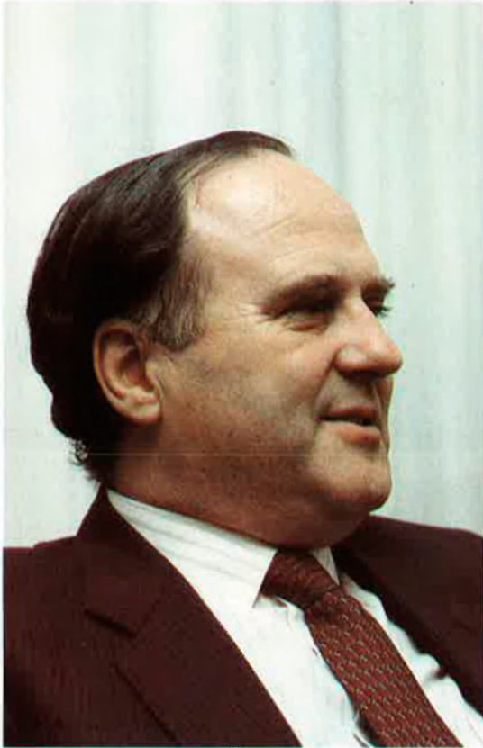
«Madrid ha embolicat la legislació».