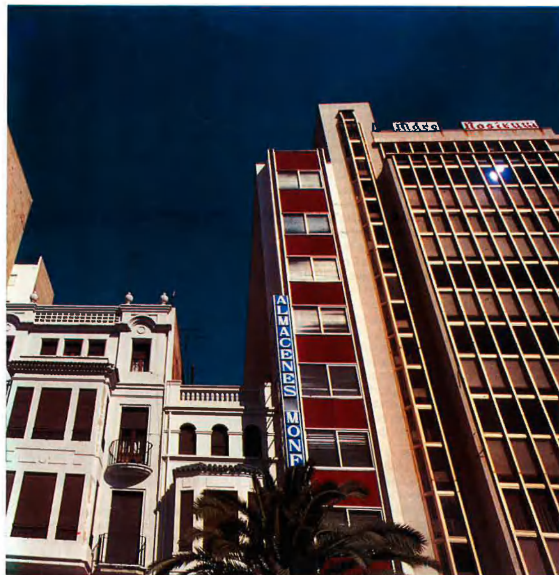
A l'esquerra, edifici Capitol i el Banc Central. Ací dalt, edificis de l'Avinguda Rei En Jaume.

en benefici del sòl privat. El 1955, Ferrer Fons va elaborar unes ordenances municipals, que, signades per Paz Maroto , pretenien actualitzar el Pla Traver i ordenar l'expansió urbanística, que havia fet que la ciutat cresqués fins a la via del ferrocarril, un obstacle encara no superat avui.