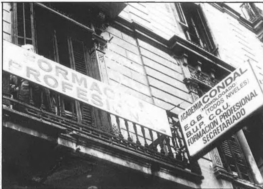
Dalt, acadèmia on estudia el fill de Royuela, niu d'skins. Baix, manifestació ultra.

Són les dues de la matinada. El bar vessa de gent i d'alcohol. El personal s'entreté conversant enmig d'una música eixordadora. De colp i volta, uns individus amb el cap rapat entren en escena. Són prop de quinze i arriben amb ganes de provocar. En breus segons el bar esdevé un veritable infern. Les ampolles de cervesa salten amunt i avall i comença a aparèixer la sang. La batalla és desproporcionada: els rapats fan sempre ostentació de tota mena d'estris de defensa personal; en tot cas els queda el recurs de les seves botes, acabades amb punta d'acer. S'esfumaran amb la mateixa rapidesa que han aparegut. Al carrer, allunyats del fragor de la baralla, un parell d'homes, propers a la quarantena, ben endreçats, hauran controlat els esdeveni-