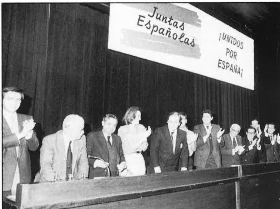
Juntas Españolas utilitza els skins com a servei d'ordre.

La vinculació entre els nazi- skins i les organitzacions de l'extrema dreta va encara més enllà. Si en una primera etapa, la «formació» ideològica de la banda era portada a través de fanzines com Descarga , Clase Obrera o Ziklon B , tots ells de marcada tendència antisemita, es pot trobar a la revista Alcantarilla , publicació de l'extrema dreta barcelonina apareguda el 1986, articles on es carrega l'accent sobre «com ha de ser i comportar-se el bon skin ».