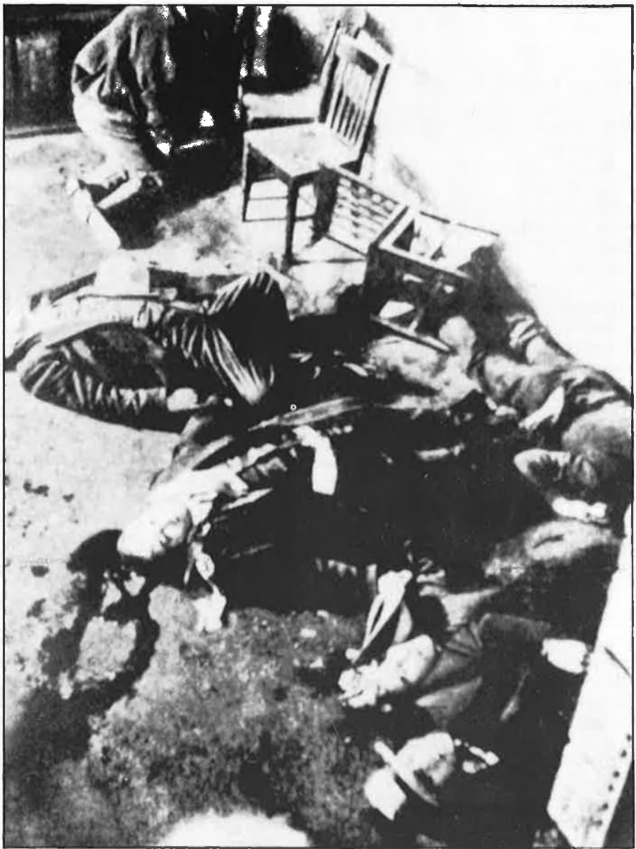
A l'esquerra, el jurat. Dalt, la matança de Sant Valentí.

Al llarg dels anys de la dècada dels vint hi havia 200 «rackets» diferents a Chicago, amb noms tan curiosos com la Germania de servidors de soda i cambres de taules o la Unió de camioners transportistes de pa, galetes, rent i empanades. Aplicaven mètodes intimidatoris a aquelles persones que no satisfien el percentatge exigít, la «quota», mètodes que anaven des de la bomba fins a la mutilació o el segrest. Capone o alguns dels seus associats arribava a controlar el 70 per cent dels «rackets» de Chicago. Ell sempre fatxendejava dient que dirigia negocis