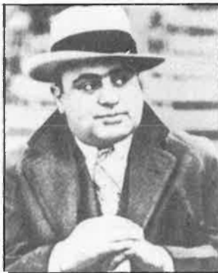
Alfons Capone, «Scarface».

Alfons Capone va néixer a Brooklyn, Nova York, el 17 de gener del 1899. El seu pare, d'origen napolità, obrí una barberia en el número 69 de Park Avenue, la qual cosa no alliberà la seua família de la pobresa. Els immigrants italians, els «dagos», eren gregaris i recelosos enfront dels estranys. Les desil·lusions, les penalitats i els brutals prejudicis que patiren en aquelles terres els van confirmar en el seu tribalisme. A més, va