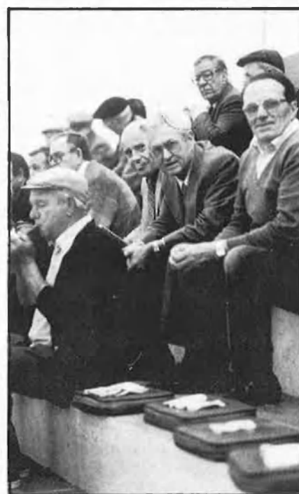
A l'esquerra, el trinquet Pelayo. Dalt, el de Borriana.