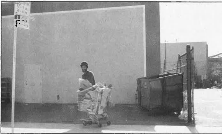
Misèria hispana a Los Angeles.

exàmens d'anglès i d'història nord-americana per a aconseguir el permís de residència.