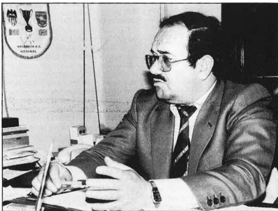
Lizondo ha matat el pacte, i més coses.

Tot començà amb les distintes pressions que des d'alguns sectors econòmics es van produir per unir les dues candidatures. En la comissió que inicialment va discutir la possibilitat, curiosament, en un principi Unió