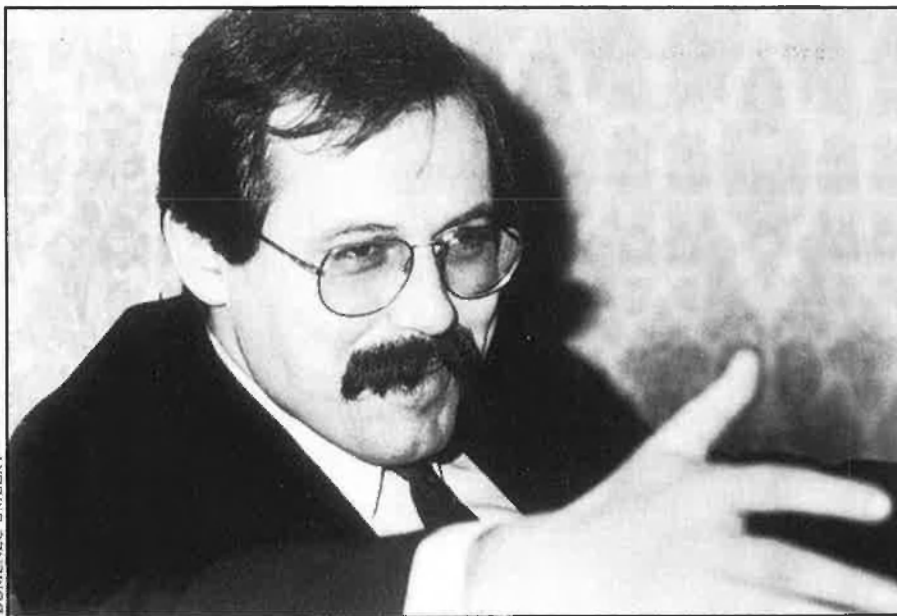
«La divisió provincial esquartera una de les poques comarques naturals de Catalunya».

—De tota manera, supose que aquests sis mesos, fins que s'aprove el reglament de la Llei de Diputacions, que regularà el quasi total traspàs de les seves competències, seran inquietants, si més no.