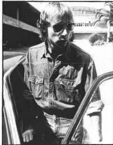
Steve Archibald, l'escocès del Barça.

—Tampoc. Però és que tampoc no m'interessa. Si hi ha una cosa que faria funcionar millor aquest club, seria que tothom es preocupés de la seva feina. Jo sóc un professional del futbol, i haig de dedicar-me a jugar i prou. Els