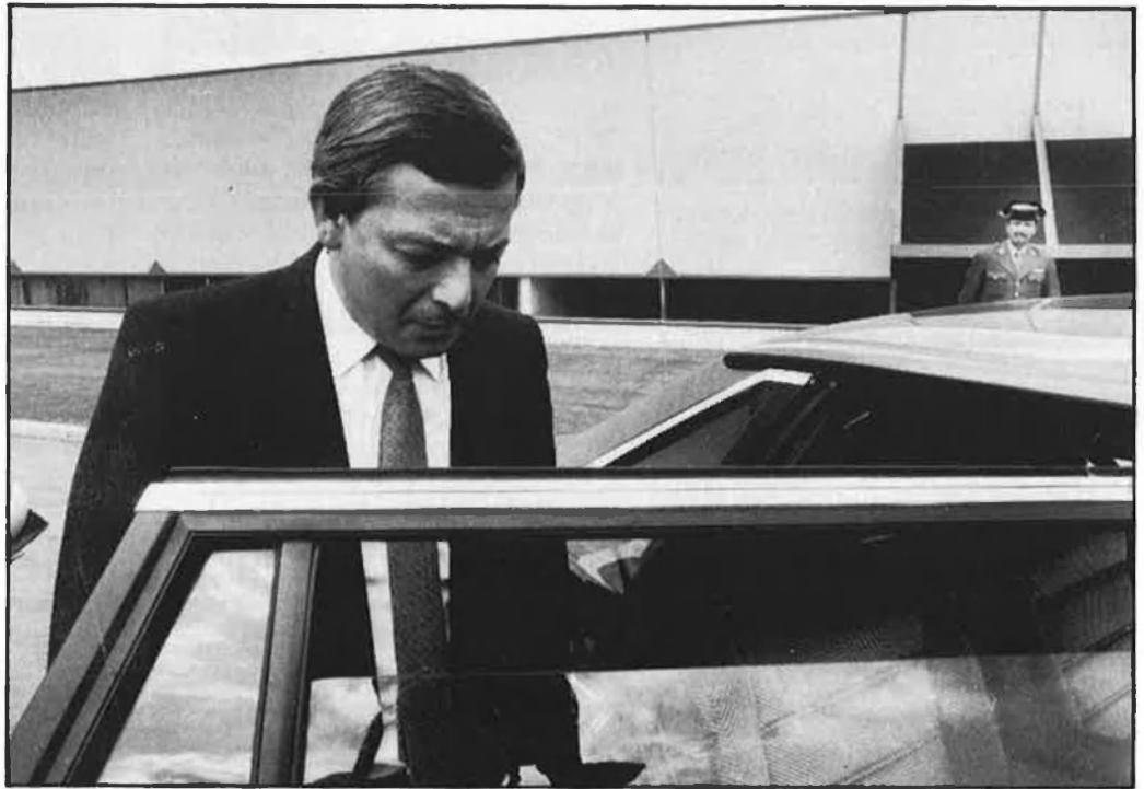
L'administració estatal, la favorita dels assistents al Congrés.