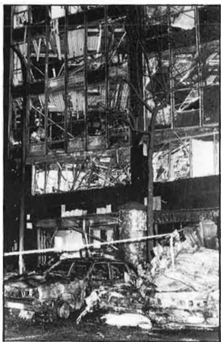
Estralls d'un cotxe-bomba d'ETA a una entitat bancària francesa.

Aquells que reben un setge més gran són els refugiats polítics fora de l'estat. Possibilitat de ser extraditats i dificultats en la renovació de la documentació i en l'obtenció de treball són sistemes legals que comencen a dificultar la situació de la comunitat de refugiats polítics catalans a la Catalunya Nord. Tot això augmentat ara amb l'acció que han provocat les suposades relacions amb ETA, com comenten fonts pròximes als refugiats.