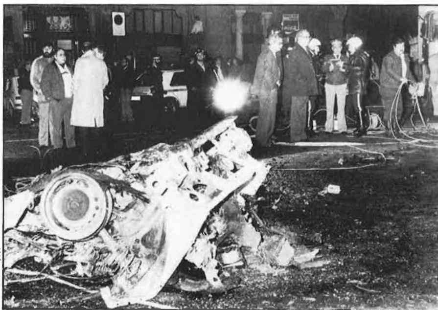
Tots els cercles independentistes, inclosos, ara, líders de Terra Lliure, neguen la col·laboració.