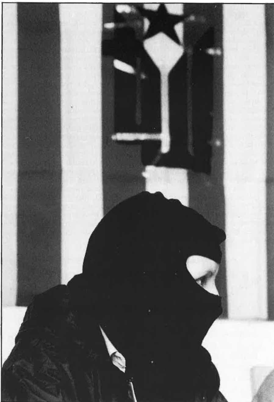
Només efectius de les forces de seguretat de l'estat veuen clar el suport logístic de Terra Lliure en els atemptats d'ETA.

Segons els Comitès de Solidaritat amb els Patriotes Catalans —CSPC—, la versió oficial estatal que vincula ETA amb Terra Lliure és un apriorisme policial fals i no és fruit de cap mena d'investigació. «Es només la voluntat de criminalitzar l'independentisme català per justificar una futura repressió».