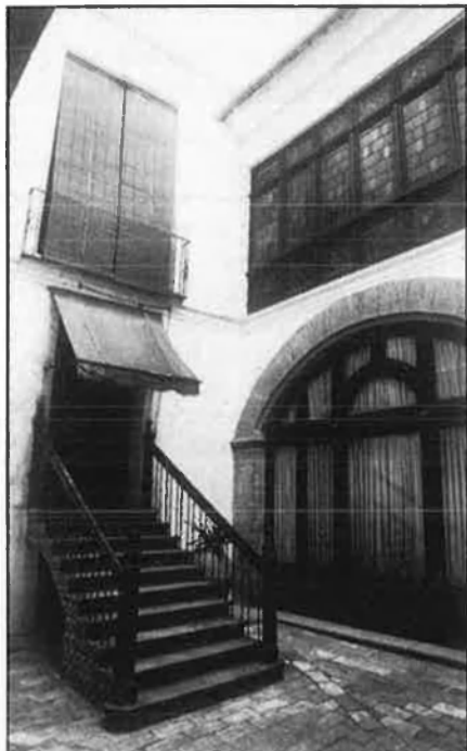
Un dels patis restaurats al carrer de Cavallers.

guns ocupen illes senceres i en el solar cap ben bé un parell de bancs, un gran hotel, o fins i tot un hipermercat, i en ple centre. A més, són incòmodes, vells, freds, clivellats, pels corredors l'aire tramuntaneja, les estances tenen un disseny fruit de quinze generacions aristocràtiques, estrofolari com a mínim, qualsevol reforma costa un ull de la cara, cal un porter, jardiner, gent que neteja, despesa allà on es mire. Com immensos dinosaures en l'era del dúplex, aquests casalots són un fòssil caríssim, inhabitable, improductiu.