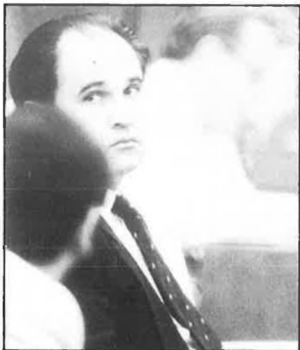
Rafael Blasco, conseller d'Administració Pública.

Més de 750 representants dels vint-i-un països que formen el Consell d'Europa han debatut durant tres dies què es pot fer des de les entitats territorials que conformen cadascun dels països del vell continent per fer front als problemes de l'ordenació del terri-