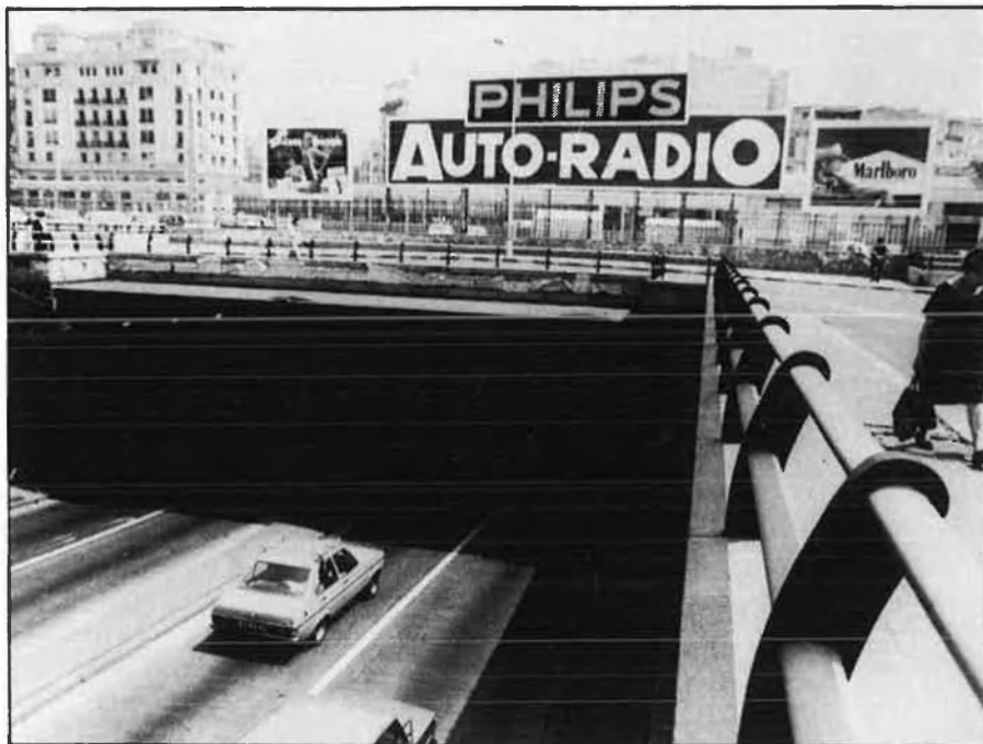
Túnel que actualment connecta les grans vies, i que circula per sota de la Renfe.

mitjançant l'aprofitament dels buits estratègics —buits sense edificar— per convertir-los en llocs d'ús públic i aprofitar les zones deixades pels plans del 66 per a autopistes, a fi de traçar ara bulevards. En aquest sentit, el nou pla incrementa en un 404 per cent l'espai dedicat a zones verdes respecte al pla anterior i un 250 per cent l'espai dedicat a equipament i servicis escolars.