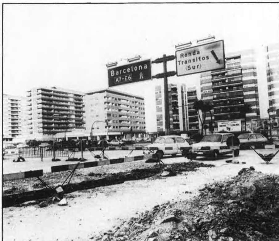
158.000 milions, en total.

La construcció del By-pass de l'auto-pista A-7 (de Puçol a Silla), que evitaria el trànsit de mercaderies perilloses per la ciutat, i el corredor comarcal que tanca pel nord la ciutat en el semianell existent de carreteres marginals del nou llit del Túria, completen les principals propostes que en el capítol de transports defineix el Pla.