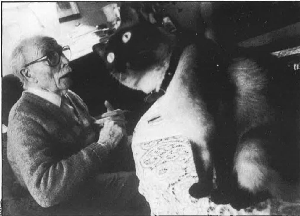
«De vegades em sorprenc, llegint-me».

—Segons què anomenem estètica ¿no?, perquè hi ha estètiques que no són, precisament, massa ètiques. Sobretot si hi incloem els escenaris. Jo he estat molt independent d'això, sempre.